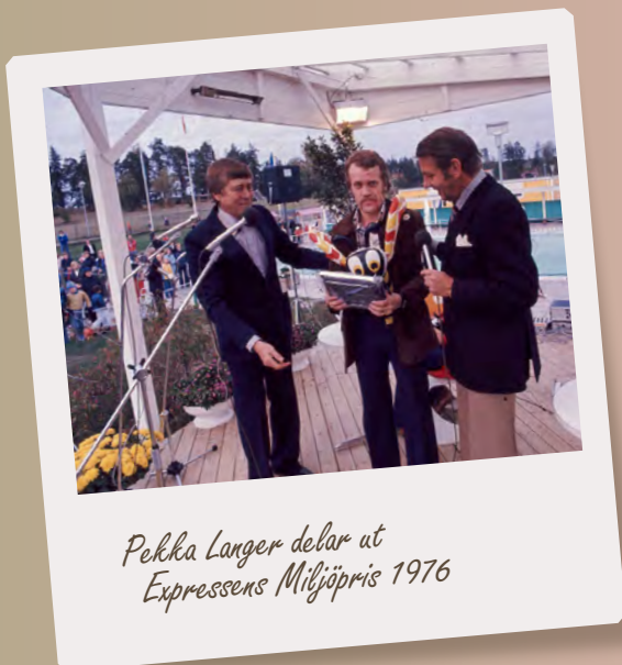
Pekka Langer delar ut Expressens Miljöpris 1976

Kommunen och Väsbyhem tilldelades Expressens första miljöpris till bästa bostadsområde för Ekeboområdet 1976 med motiveringen "För den insikt om vad människan behöver i sitt dagliga liv".