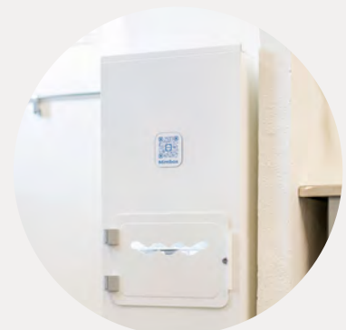
Mimboxen filtrerar bort mikroplaster ur tvättvattnet. Den analyserar också hur rent vattnet är.

– Vi vill bidra till att minska vårt klimatavtryck och nå FN:s globala mål. På så sätt hjälper vi både våra hyresgäster och planeten. ■