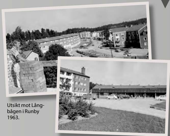
Utsikt mot Långbågen i Runby 1963.