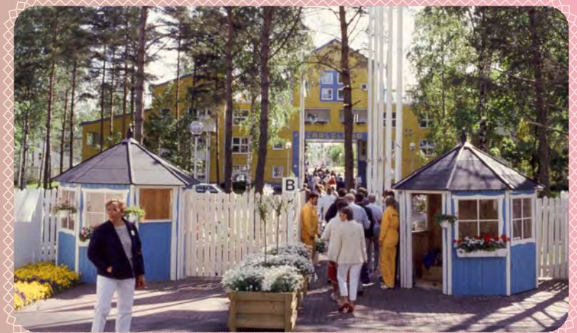
Framtidens flerbostadshus i Carlslund.

Byggtakten var fortsatt hög och 1980-talet var en mycket händelserik tid i Väsbyhems historia. Hela 1 575 nya bostäder, inflyttning i bland annat Prästgårdsmarkens allélängor och vinkelgårdar samt i Hagängens låghus, fristående parhus och tvåvåningshus. Väsbyhem provade under den här tiden att bygga kollektivboende i Prästgårdsmarken bestående av sju villor med vardera fem lägenheter och 18 lägenheter med upplåtelseformen Kooperativ hyresrätt på Folkparksberget, dessa är dock inte längre kvar i Väsbyhems ägo.