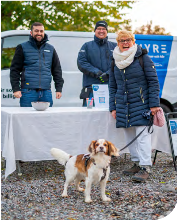
Under bilpoolsdagen fick hyresgästerna information om bilpoolen och se några av bilarna.